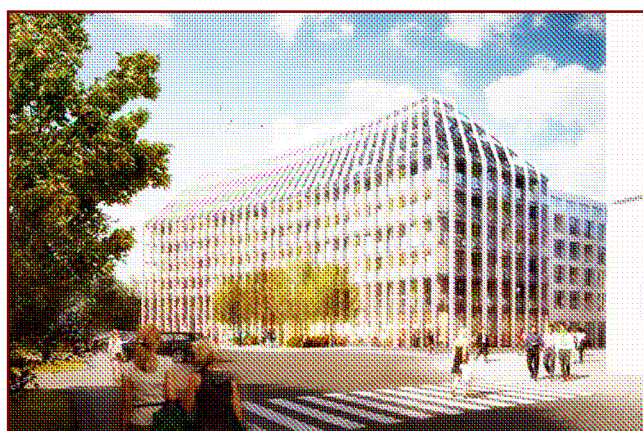
Upravený návrh - Bílý medvěd v kleci