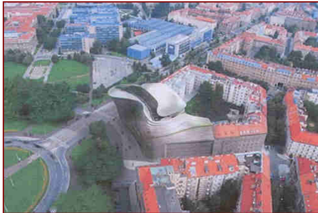
Bílý medvěd na Vítězném náměstí, Praha 6