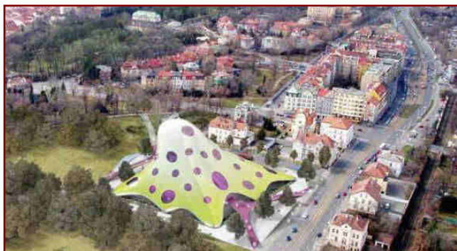
Návrh knihovny – Chobotnice - na Letné v Praze