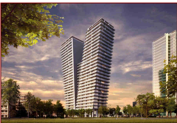
Věžko na pankrácké pláni