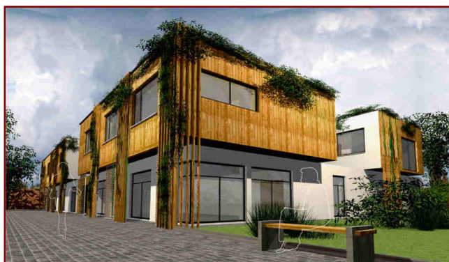
Návrh stavby před průčelím zámku v Liblíně