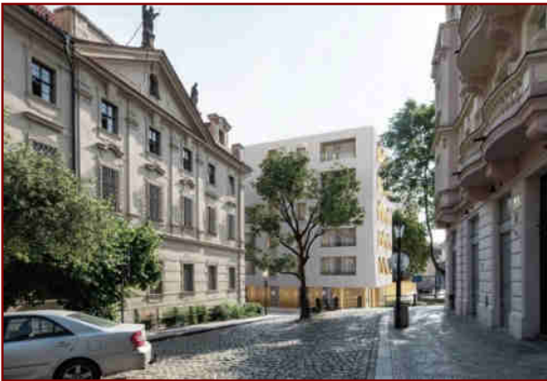
Maršmeloun si své dimenze i po korekci ponechal