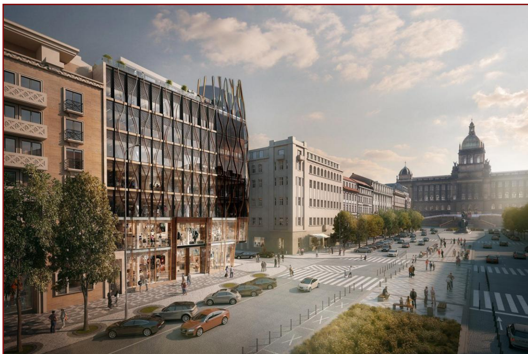
Vizualizace Květinového domu z dokumentace investora

Příznivý vývoj se v minulých dnech zastavil. Je demolován v podstatě nenahraditelný dům. Výstavbou květinového domu by se vrátila do horní části náměstí heterogenita a chaos. Vyrovnaná silueta zástavby horního náměstí by byla porušena, odlišný materiál a zborcení svíslé roviny fasády by zničil záměrné zjednodušení fasád podporujících dominantní úlohu Muzea. Památky nejsou jednotlivé artefakty, jsou nedílnou součástí celku chráněného území (tudíž i zástavby nechráněné) a naopak. Tuto skutečnost naše památková péče dosud nevnímá. Selhává na fragmentaci vnímání skutečnosti, na neschopnosti vidění v širších souvislostech. Chabou omluvou pro ni může být, že v současnosti netrpí tímto nedostatkem sama. Pochopí konečně hrozící nebezpečí a najde v sobě dost zodpovědnosti a odvahy, aby aspoň úpravou architektonického ztvárnění novostavby zabránila vážnému poškození koncepce náměstí?