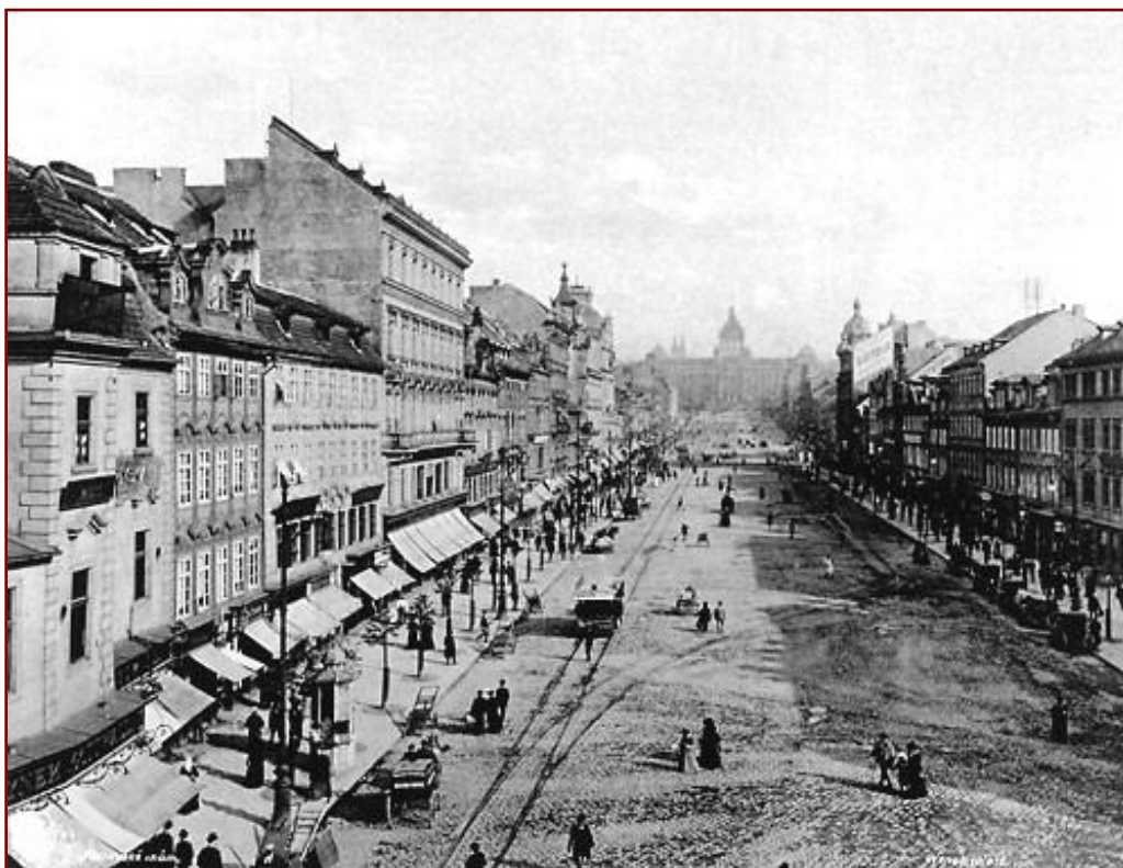
Václavské nám. v 19. století

o konzervování všeho starého za každou cenu, jde o kontinuální proces změn směřujících k vyjasňování smyslu kompozice města. Dokládá to dosavadní vývoj Václavského náměstí: