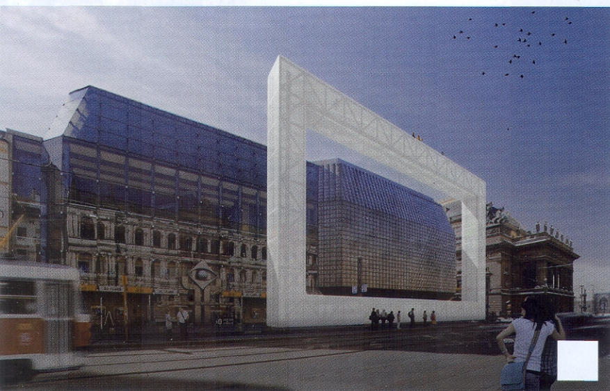
Třetí místo pro ateliér COLL COLL ctí budovu od Karla Pragera tak, že se jí ani nedotýká.