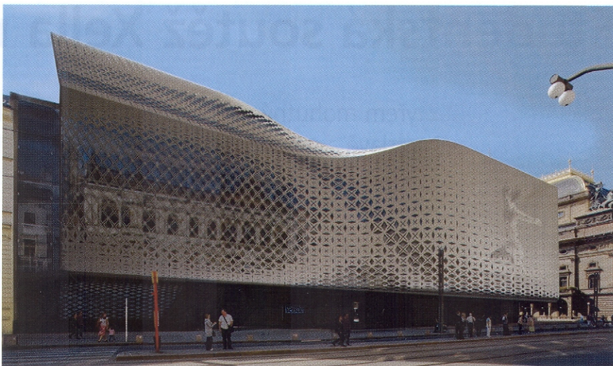
Vítězný návrh Jiřího Matury – pohled od Národní třídy