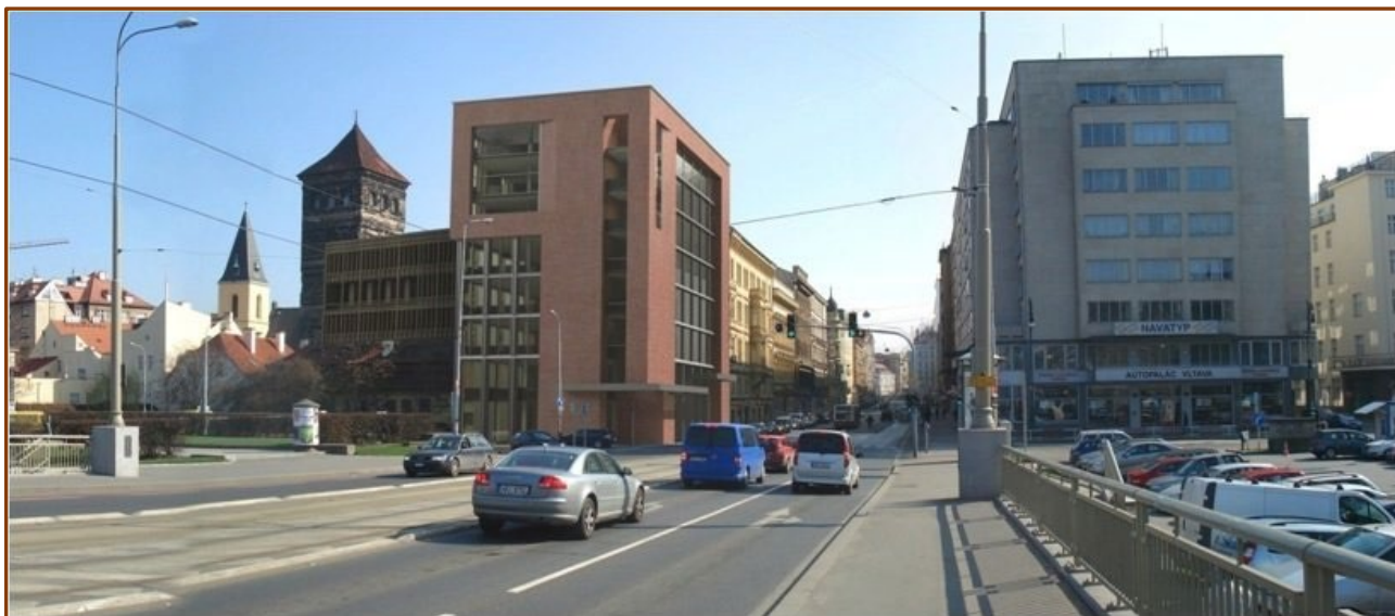
Jiné návrhy náhrady domu č. p. 1502 v Revoluční ul.