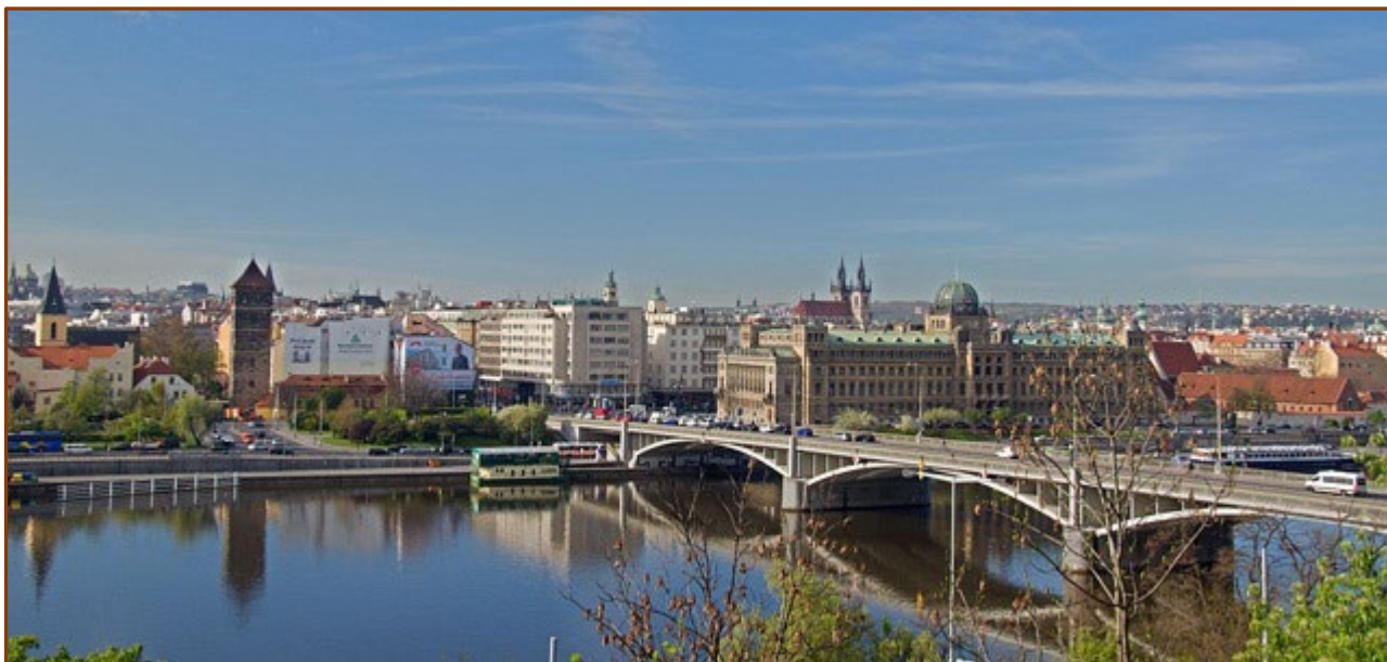
Současný stav – pohled z letenského svahu

V Lidových novinách vyšel před časem článek o návrhu Evy Jiříčné na řešení velmi obtížné úlohy, která se opakovaně vrací od padesátých let minulého století – ukončení Revoluční třídy u Švermova mostu. Následovala podrobnější výstava projektové dokumentace. Jde o jednu z nejobtížnějších úloh, která v Praze čeká na řešení. Dosavadní výsledky soutěží byly do té míry nepřesvědčivé, že naštěstí k realizaci nedošlo.