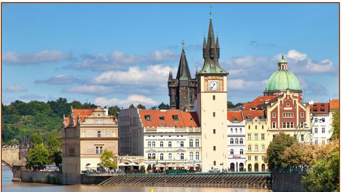
Staroměstská vodárenská věž

Staroměstská vodárna u Staroměstských mlýnů u Karlova mostu ovládá přilehlé historické stavby mlýnů v předmostí Karlova mostu a sjednocuje různorodou zástavbu do jednoho celku.