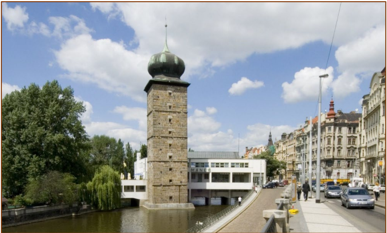
Renesanční vodárenská věž u Mánesa

Skupina u Mánesa na Masarykově nábřeží je zajímavá kompozičně zdařilým spojením renesanční věže s funkcionalistickou budovou. Nová horizontála upevňuje dominantní vertikálu věže na vodní hladině a zprostředkovává jedinečným způsobem spojení nábřežní zástavby s řekou. Historická dominanta věže je tu zachována i se svými prostorovými nároky.