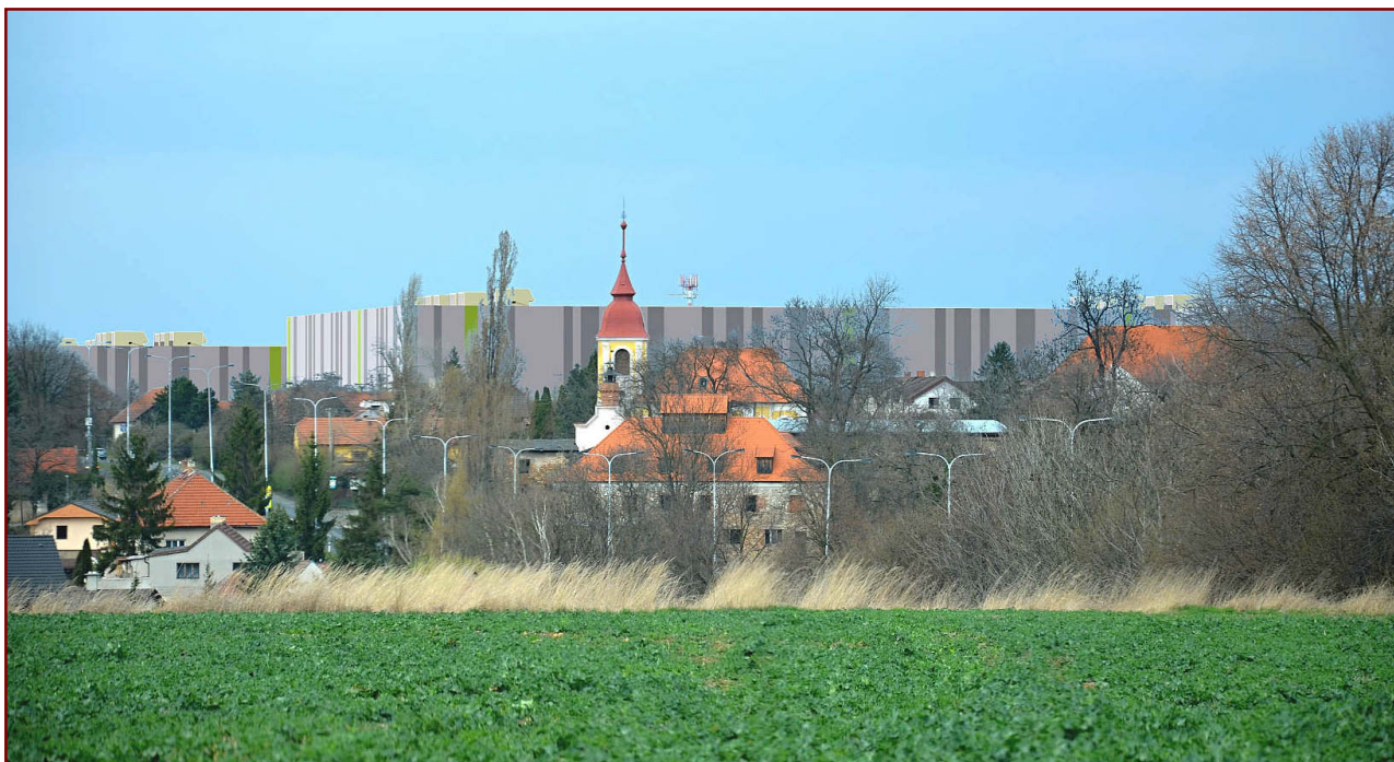
Vizualizace dle původního zfalšovaného výškopisu v dokumentaci

Ve všech výše uvedených hodnoceních dopadů záměru Goodman Zdiby Logistic Centre na krajinu a kulturní památky považujeme za zásadní absenci posouzení vlivu hal na zástavbu obce v přímém sousedství logistických hal , která je jako celek životním prostředím jejích obyvatel. Její měřítko, prostorové vztahy, architektura mají trvalý vliv na každého, kdo v obci žije – i na ty, kteří si tento vliv neuvědomují nebo ho dokonce popírají.